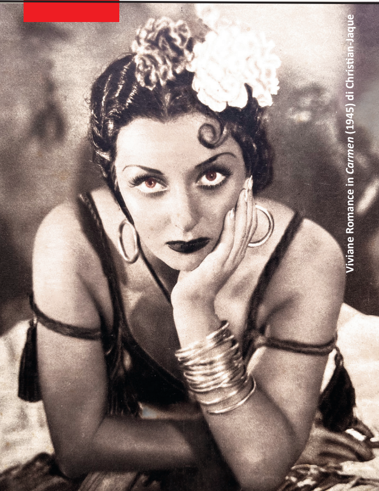
Viviane Romance in Carmen (1945) di Christian-Jaque